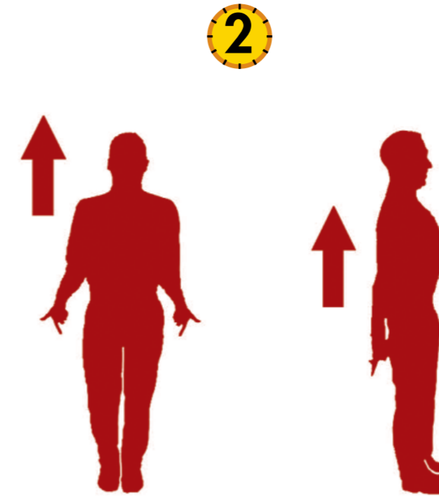
'DE VLEUGELS VAN EEN ENGEL'

Zit op de rechter knie, linker been voorwaarts gebogen. Romp goed rechtop houden, buikspieren opspannen, golfclub met gestrekte armen boven het hoofd. Buig langzaam de romp naar de linkerzijde, hou het hoofd in evenwicht tussen de schouders. Voel een stretch in de rechter heup. Deze houding 30 sec aanhouden. Voor de linkerkantstretch de houding 15 sec aanhouden.