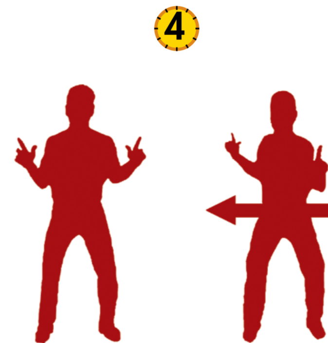
X-FACTOR CHECK UP

Lichte spreidstand, rechtervoet voorwaarts, armen gebogen naast het lichaam. Strek uw armen traag naar voren in een traag duwende beweging (tegen een ingebeeld voertuig). Voel hoe de schouders, nek, buikspieren, bilspieren en beenspieren samenwerken alsof je een hydraulische pomp zou zijn. Hou de positie 30 sec aan. Zelfde oefening met het linkerbeen voorwaarts. "Neem de golfhouding aan en doe een swingbeweging." Voel de samenwerking van schouders, nek, buikspieren, bilspieren en beenspieren in de swingbeweging.