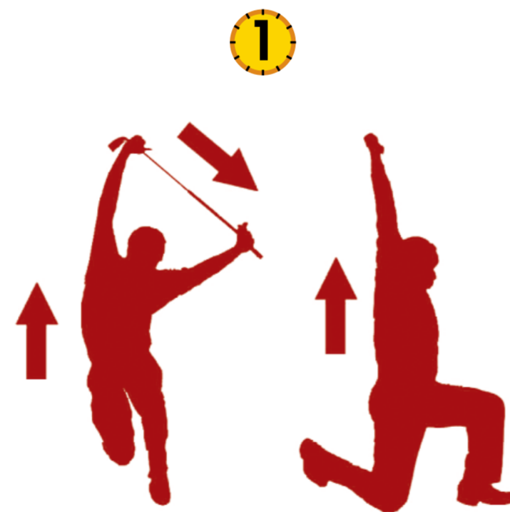
HEUP, ROMP EN SCHOUDER STRETCH

STOP de oefening wanneer u een scherpe pijn voelt, bij duizeligheid of bij elke andere acute omstandigheid.